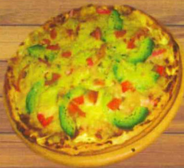
トマトとアボカド